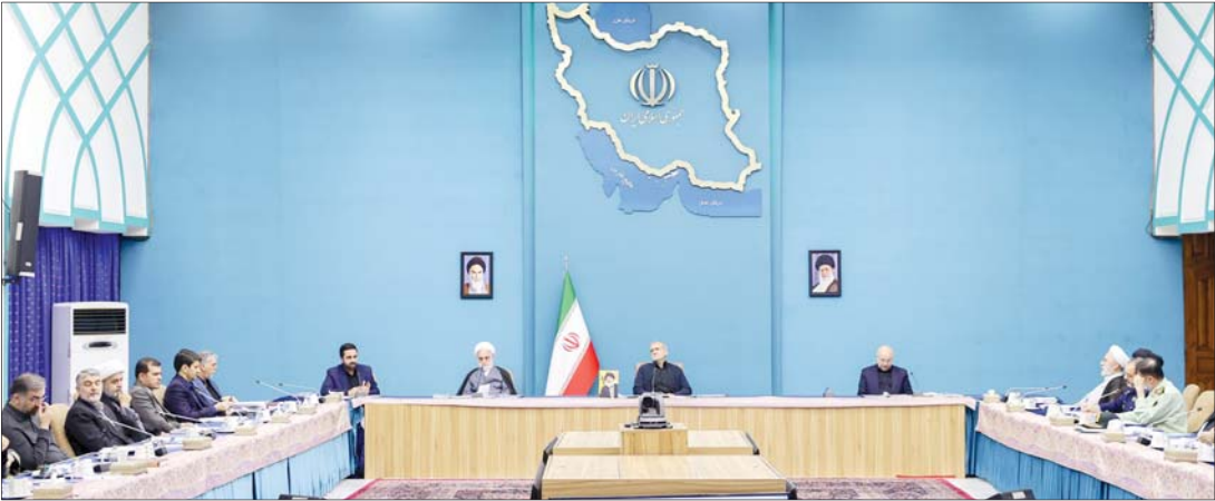
عکس از نشست اطلاع‌رسانی در تهران

✪ سفير سابق ايران در عربستان و کارشناس ارشد مسائل غرب آسيا