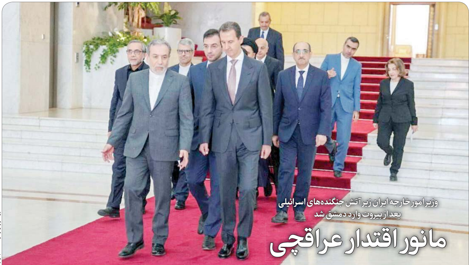
وزیر امور خارجه ایران زیر آتش جنگنده‌های اسرائیلی بعد از بیروت وارد دمشق شد